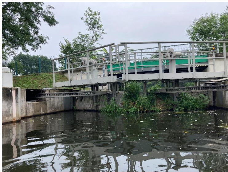
„...siehste, man braucht gar keine Blumentöpfe“ (Susi)

Tschüss und winke winke sagt dohr Diehdschej.