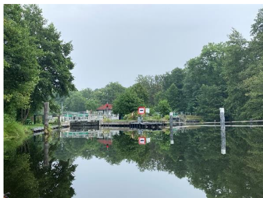
...Schleuse Hermsdorfer Mühle

Die geliehenen Boote sind zwar gebraucht aber eben mit Steuer ausgestattete ordentliche Prijons. Schnell sind sie vom Trailer runter und im Wasser.